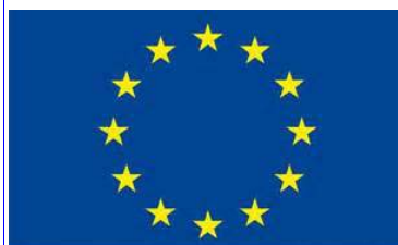
COMMISSIONE EUROPEA Rappresentanza in Italia

Gli iscritti potranno registrarsi online gratuitamente presso la piattaforma S.I.Ge.F. e scaricare il foglio d'iscrizione da presentare il giorno del corso.