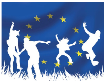
Servizio Volontario Europeo