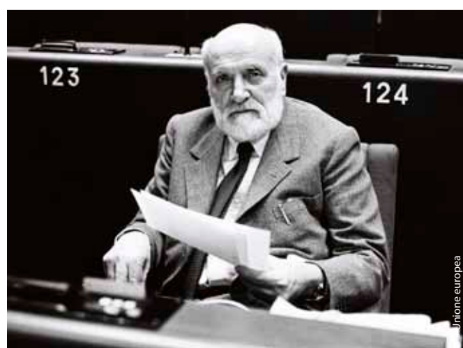
Spinelli al Parlamento europeo, poco tempo dopo l'adozione da parte dello stesso del suo piano per un'Europa federale nel 1984.

Nonostante non tutte le sue idee ambiziose siano divenute realtà, Altiero Spinelli ha perseguito accanitamente il proprio obiettivo di un governo europeo sovranazionale con il fine di evitare altre guerre e di unire i paesi del continente in un'Europa unita. I suoi pensieri hanno ispirato molti cambiamenti nell'Unione europea, in particolare l'aumento significativo dei poteri del Parlamento europeo. Il Movimento federalista organizza ancora oggi incontri periodici sulla piccola isola di Ventotene. Altiero Spinelli morì nel 1986 e l'edificio principale del Parlamento europeo a Bruxelles porta il suo nome.