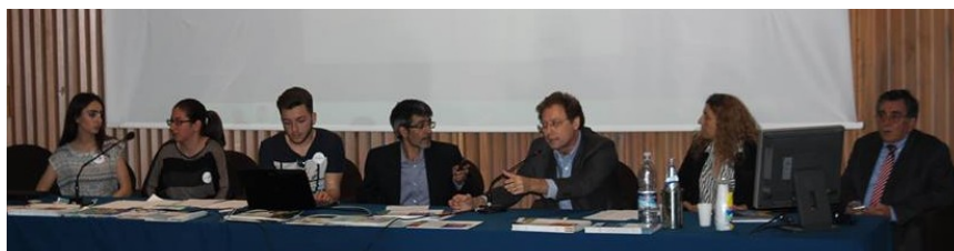
Foto dell'evento dello scorso anno

90141 Palermo Tel. 091 335081 carrefour-sic@hotmail.com - carrefoursic@pec.it Facebook: Euromed Carrefour Sicilia Europe Direct Twitter: Euromed Carrefour