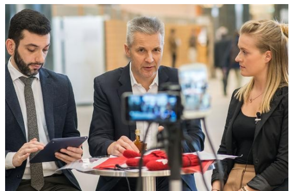
Artis Pabriks durante l'intervista su

Riguardo alla critica concernente il fatto che il cibo che non rispetta gli standard europei possa invadere il nostro mercato, la risposta è stata: “Il punto è che questo accordo non consente un abbassamento degli standard nel nostro continente. I canadesi hanno la stessa mentalità degli europei. Ci sono certi settori dove gli standard europei sono più elevati, in altri sono più stringenti quelli canadesi. L'accordo è basato sulle migliori pratiche da entrambe le sponde dell'Atlantico. I canadesi ci guadagneranno e noi anche”. L'accordo commerciale Ue-Canada ha l'intento di far crescere flussi di commercio e investimenti tra Europa e il paese nordamericano da 36 milioni di abitanti. Europa e Canada hanno firmato l'accordo lo scorso 30 ottobre ma deve essere ancora ratificato dal Parlamento europeo prima che possa entrare in vigore. L'Europa è già oggi il secondo partner commerciale più importante e i flussi commerciali dovrebbero aumentare circa del 20% una volta che il Ceta sarà completamente in vigore.