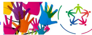
Servizio Civile Nazionale

http://www.agenziagiovani.it/images/ANG-Avviso_valutatori_Anno_2016_rev_28.12.pdf