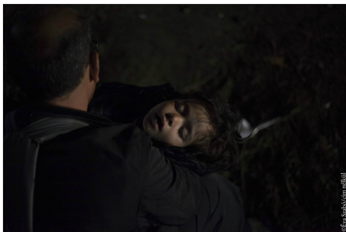
La foto vincitrice di settembre è di Éva Szabó "Cím nélkül" (senza titolo) © Éva Szabó/ cím nélkül

La foto migliore per il tema di settembre "demografia e migrazione" è stata scattata da Éva Szabó, 29 anni, fotografa freelance di Budapest. La foto è stata scattata in un campo profughi provvisorio, il padre stava aspettando l'autobus con il bambino.