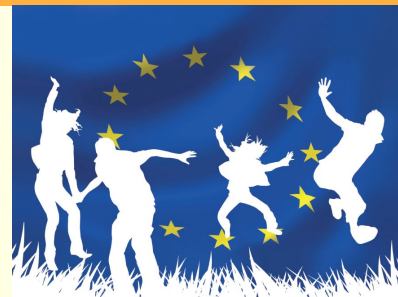
Servizio Volontario Europeo