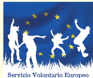
Servizio Volontario Europeo

Posti disponibili: n° 1 Ente di accoglienza: Jaunimo savanoriškios veiklos centras "Deineta" Dove: Kurtuvenai (Lithuania) Partenza: 05/03/2014 Durata: otto mesi Ambito: ambiente, sviluppo rurale Breve descrizione dell'attività da svolgere : Il volontario selezionato avrà l'opportunità di acquisire conoscenze nella protezione dell'ambiente, infrastrutture turistiche e aree ricreative. Sarà impiegato maggiormente come assistente per aiutare gli specialisti del parco nel loro lavoro quotidiano. Le attività prevalenti sono: