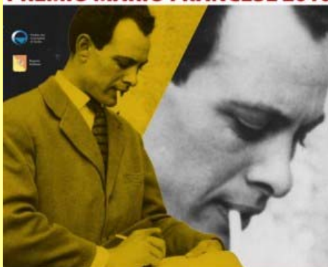
SABATO 27 NOVEMBRE 2010 SIRACUSA - Sala convegni Opco (Largo Logoteta - Ortigia)