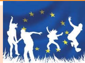
Servizio Volontario Europeo

Per eventuali informazioni www.cerasuolovittoria.eu