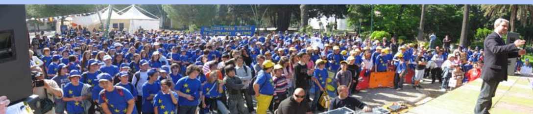
La Festa dell'Europa dello scorso anno

Per informazioni: tel.: 091 335081 carrefoursic@hotmail.com