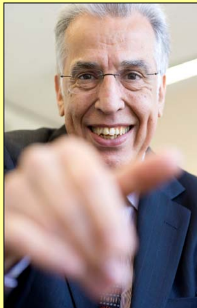
European Ombudsman Nikiforos Diamandouros

La Carta dei Diritti fondamentali diventa legalmente vincolante, come i Trattati: e ricordo che l'Art.41 della Carta dice che avere una buona amministrazione è un diritto fondamentale di