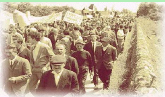
Il Ministero del Lavoro

e delle Politiche Sociali ha pubblicato sulla Gazzetta Ufficiale della Repubblica Italiana n.99 del 29.04.2010, il decreto 21.04.2010 inerente la determinazione delle retribuzioni medie giornaliere per talune categorie di lavoratori agricoli ai fini previdenziali per l'anno 2010.