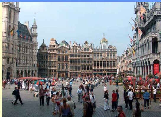
Una piazza di Bruxelles

Circa 50 milioni di euro saranno presto disponibili per sostenere progetti europei di energia intelligente nell'ambito dell'invito a presentare proposte per l'anno 2008 . Lo European Info Day 2008 che si svolgerà a Bruxelles il 31 gennaio prossimo dalle 9.00 alle 12.45 intende fornire ai partecipanti le informazioni essenziali per la presentazione dei progetti e per trovare partners. L'Info Day sarà anche trasmesso in diretta su ManagEnergy internet Broadcast Service . Registrazioni video ed altro materiale sull'incontro saranno resi disponibili online dopo l'evento. La registrazione per partecipare è possibile unicamente online. Per registrarsi è necessario creare precedentemente un account quindi procedere con la registrazione . L'invito a presentare proposte 2008 sarà pubblicato nella seconda metà di febbraio con dettagli sulle priorità per i finanziamenti, condizioni di partecipazione, criteri di valutazione e modalità di candidatura. A partire da marzo 2008 saranno organizzati degli Info Days nazionali in tutta Europa di cui sarà presto pubblicato il calendario on line.