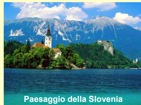
Paesaggio della Slovenia

http://www.emuni.si/en/strani/29/EMUNI-University.html