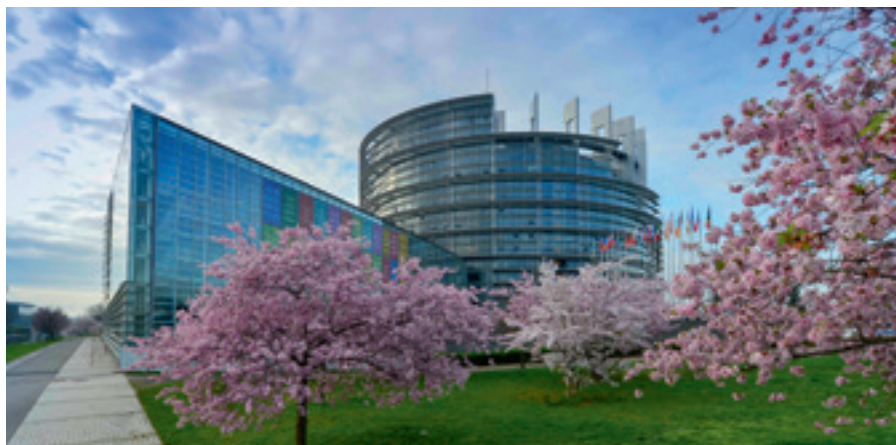
© Unione europea, 2014. Fonte: Parlamento europeo Louise WEISS building: © Architecture Studio